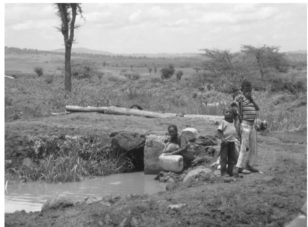
Upstream water use by local smallholders

installed to produce vegetables and fruits. This farm was only operational for a few years, after which the land was partly given to smallholders, the rest remaining unused. Around 2005, the government allocated approximately 140 hectares to floricultural and horticultural investors from abroad. The land was taken from the former state farm and also from local farmers.