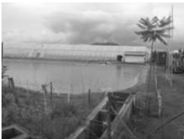
Water reservoir of an investment farm

When the nine investment farms became operational, water scarcity increased, according to all interviewed parties. This resulted in water conflicts at the water gates, where the investment farmers had sent their own water guards, while the local farmers were still using their own water guards to open and close the canals. To solve the conflict, one investor founded an association to manage and maintain the canal system. This new association was established without any governmental involvement and managed by a chairperson, his assistant and a farmers' representative. A former governmental extension worker was appointed as the chairperson, and an employee of one of the investment farms as his assistant. The new association called for regular meetings, but usually, not many representatives from both sides would attend the meetings due to work commitments.